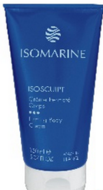
ISOMARINE BY AKEO ISOSCUPT Crème fermeté corps 32,50 €

Même totalement inconsciemment, ce bleu nous évoque le repos. Sentiment de paix et de sérénité, PANTONE 19-4052 Classic Blue est comme un refuge pour l'esprit. Il favorise la concentration à travers une clarté inégalée. Il recadre notre pensée. Il stimule la résilience en étant propice à la méditation.