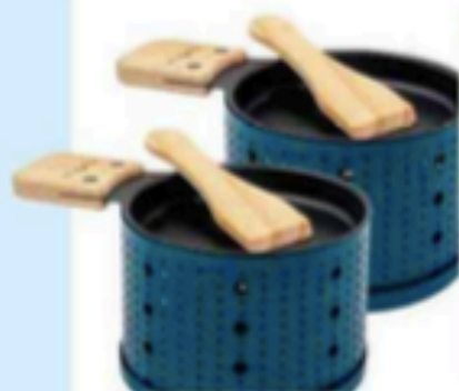
Écologiques Sets pour raclette à la bougie, en bois et métal, Cookut, 25,90 € les 2.