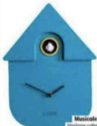
Musicalité Horloge cabane à oiseaux, en plastique, Coutou Moderne sur cadeau-maestro.com, 64,90 €.