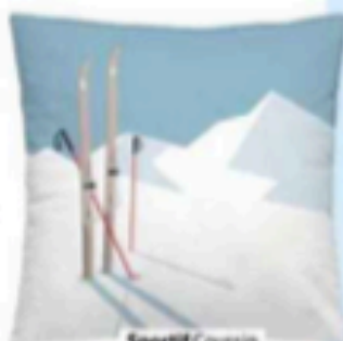
Sportif Coussin en velours, finition passepoil, Mountain, Pôdevache, 59,90 €.