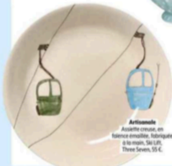
Artisanale Assiette creuse, en faïence émaillée, fabriquée à la main, Ski Lift, Three Sevens, 55 €.