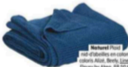
Naturel Poil nid-d'abeilles en coton, coloris Allot, Beely, Linen, Fleury by Aken, 88,50 €.