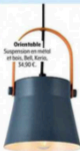
Orientable Suspension en métal et bois, Bell, Keris, 34,90 €.

Synonyme de bien-être et de fraîcheur, cette couleur s'inspire, en hiver, des glaciers et des ciels sans nuages. On ose les teintes plutôt froides mais douces, que l'on réchauffe avec une déco poétique qui fleurit bon les sports de glisse et la nature.