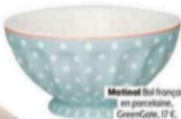
Métallic Bol français en porcelaine, GreenGate, 17 €.