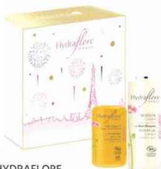
HYDRAFLORE Coffret rituel réconfortant Rose Caresse 35 € Huile de beauté visage, corps et cheveux (100 ml) Gel douche confort (200 ml) www.laboratoires-roig.com