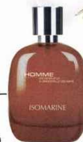
ISOMARINE BY AKEO Eau sensuelle à l'Immortelle des Mers En spray 100 ml - 34,90 € www.akeostore.com