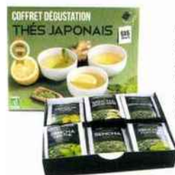
AROMANDISE, Coffret de thés japonais en infusettes Coffret de 36 sachets de thé - 12,90 € www.aromandise.com