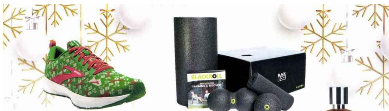
BROOKS - Revel 4 Run Merry- édition spéciale Noël 100 € - www.brooksrunning.com/fr_fr