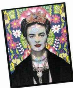
OSTARIA Toiles imprimées Frida (ref 33161) - Toile - 45 x 60 cm - 14,90 € l'une www.ostaria.fr