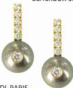
JDL PARIS Boucle d'oreille Sparkle VIP en or jaune et diamant - 2 320 € www.jdlparis.com