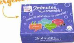
2 minutes ensemble!® connecte les générations, favorise le dialogue, l'échange et la transmission. 14,99 € www.2minutesdebonheur.com