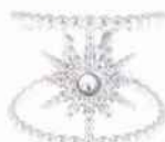
Ikita- Bague en acier argenté strass étoile - 20 € - www.ikita.fr