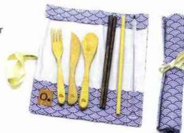
ZERO, Pochette nomade de couverts écologiques Ensemble de 3 couverts en bois de bambou biodégradable fabriqués à Bali. Pochette nomade est complète, chic et ultra-pratique. 35 € Disponible sur doux-good.com et zeroofficiel.com