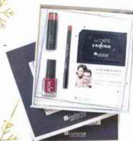
CARLANCE Coffret pack beauté, 40 € Une carte cadeau d'une valeur de 25 € 1 vernis à ongle (au choix) 1 rouge à lèvres (au choix) 1 crayon à lèvres (au choix) www.carlance.fr