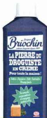
Artisanale Une crème multusage, à base de kaolin breton. La pierre du droguiste, Briochin, 7,95 € les 750 ml.