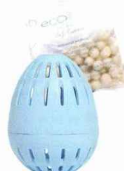
Ultra-doux Œuf de lavage machine (jusqu'à 720!), à remplir de granulés minéraux. Ecoegg sur Qvc.fr, 25 €.