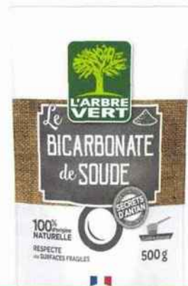
Traditionnel Bon à tout faire, l'indispensable bicarbonate. Secrets d'Antan, L'Arbre Vert, 3,49 € les 500 g.