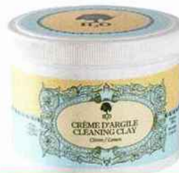
Polyvalente Pour nettoyer sans rayer, crème d'argile au citron, labellisée Ecocert. H2O at Home, 16,20 € les 500 g.