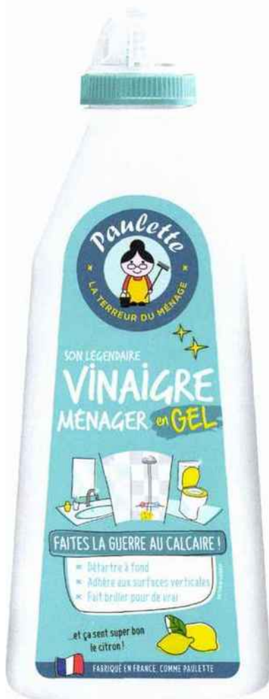
Goutte-à-goutte Vinaigre formulé en gel pour plus d'efficacité, parfum citron. Paulette, 2,80 € les 500 ml.

Préparer ses produits ménagers soi-même, c'est l'idéal. Mais quand on manque de temps, on peut aussi compter sur du prêt à l'emploi naturel et de qualité. Si, si, ça existe! PAR ANGÉLIQUE VALLEZ