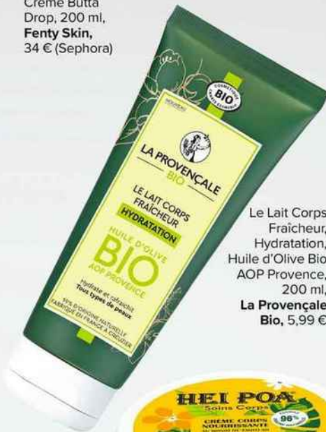
Le Lait Corps Fraîcheur, Hydratation, Huile d'Olive Bio AOP Provence, 200 ml, La Provençale Bio, 5,99 €