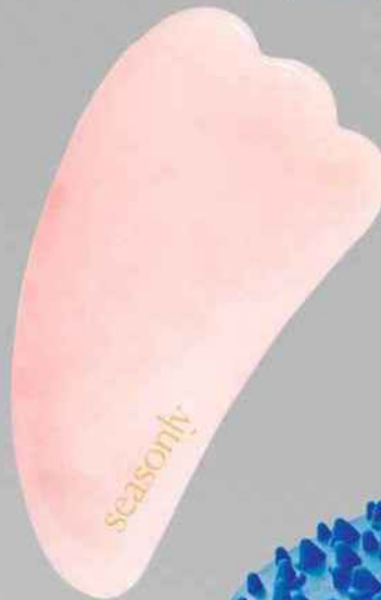
Quartz Gua Sha, Seasonly , 25 € (Sephora)