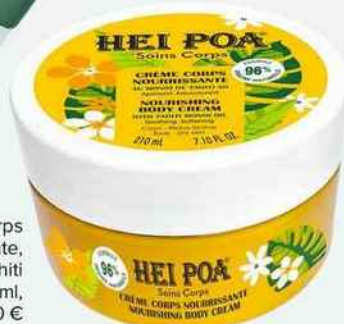
Crème Corps Nourissante, au Monoï de Tahiti AO, 210 ml, Hei Poa, 14,50 €