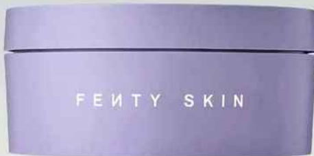
Crème Butta Drop, 200 ml, Fenty Skin, 34 € (Sephora)