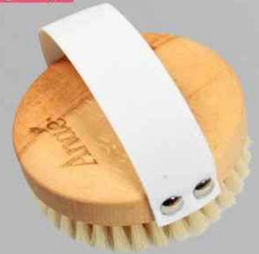
Brosse pour Massage, Ronde, Anae , 10,99 € (Kazidomi)